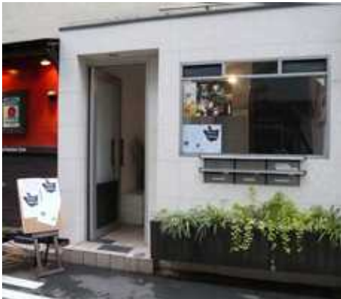
ザンマイムイ入口